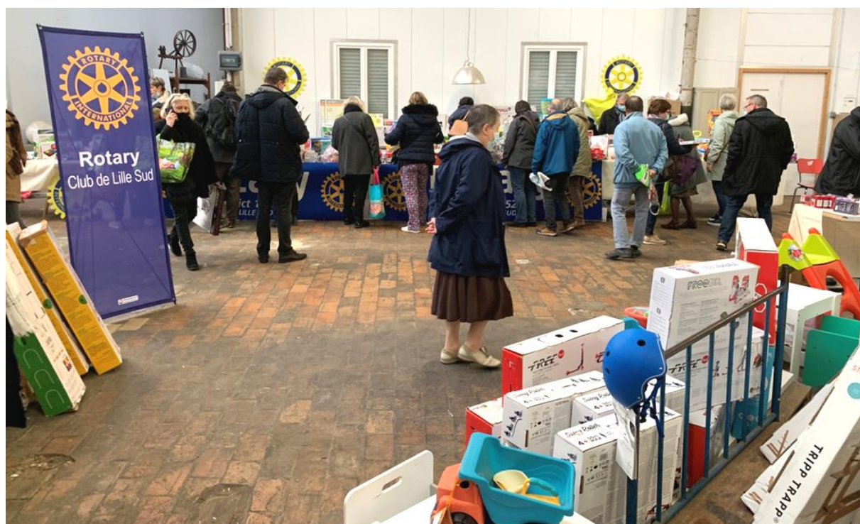
La foule des acheteurs se presse devant les stands