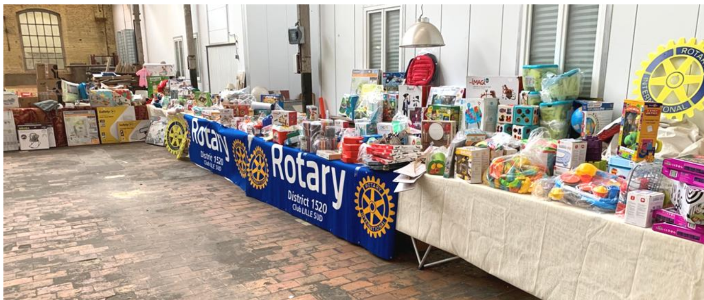
Un étalage superbement garni