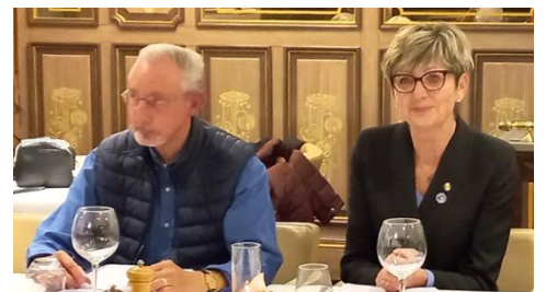
Trésorier et présidente sont fort sérieux...