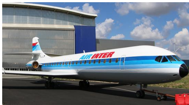
La Caravelle aux couleurs d'Air Inter