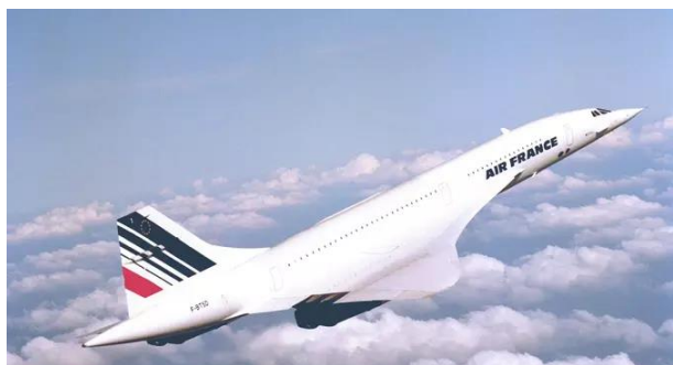
Le Concorde d'Air France prend de l'altitude vers New York